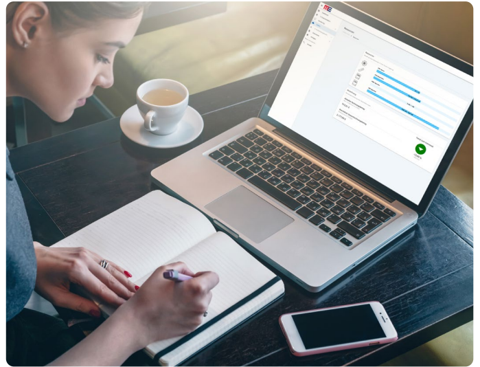
Volle Transparenz durch integrierte Ressourcen- und Kostenkontrolle