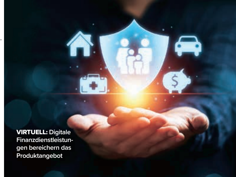
VIRTUELL: Digitale Finanzdienstleistungen bereichern das Produktangebot