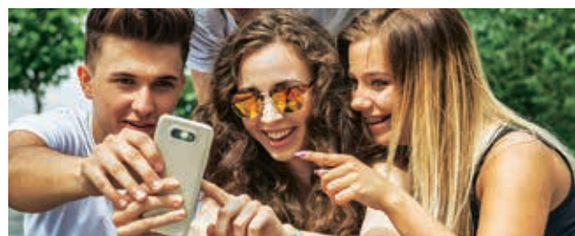
MARKENWAHL: Junge Käufer hören auf die Meinung der Freunde